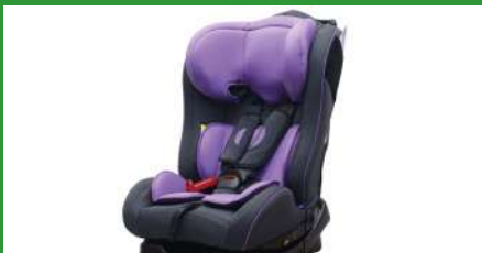
Автокресло группы II для детей массой 15-25 кг