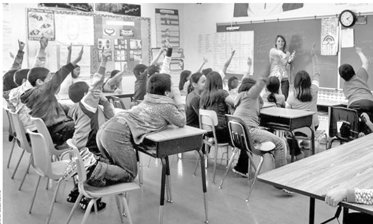
Занятия в одной из канадских школ