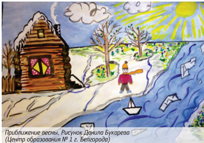
Приближение весны. Рисунок Даниила Букарева (Центр образования № 1 г. Белгорода)