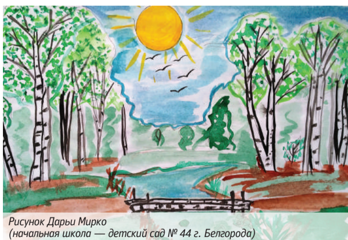
Рисунок Дарьи Мирко (начальная школа — детский сад № 44 г. Белгорода)