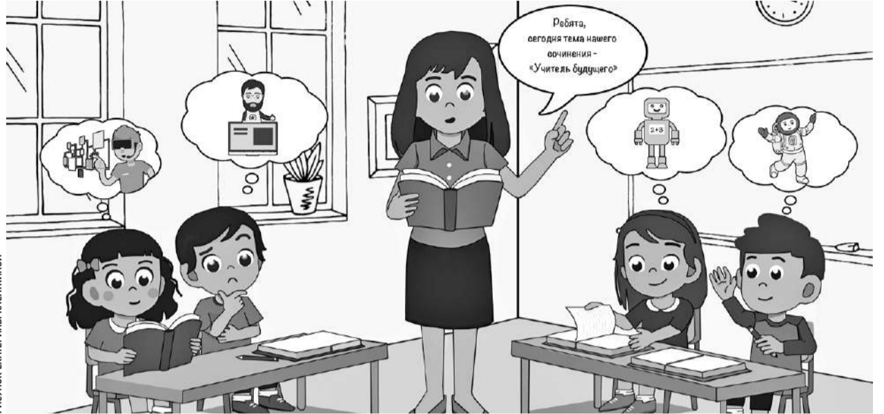
РИСУНОК ЕКАТЕРИНЫ КАСАКИНОЙ

Общая сумма выделенных средств — 10 млн рублей. Из них федеральное финансирование — около 8,5 млн. Почти 1,4 млн —